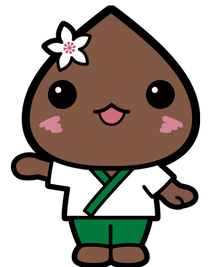
幌加内町マスコットキャラクター「ほろみん」